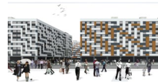
Екатеринбург, ул. Шефская