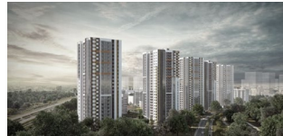
Санкт-Петербург, ул. Седова